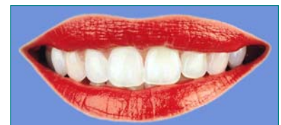
Nahezu alles ist möglich: vom Einzelzahn-Implantat bis zur implantatgetragenen Prothese.