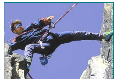
Zahn-Implantate bieten Sicherheit, festen Halt, Ästhetik und hohen Tragekomfort.