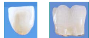
Mit einer Galvanokrone nachgebildeter Zahn.