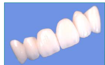
Frontzahnücke mit zahnfarbener Keramik verblendet